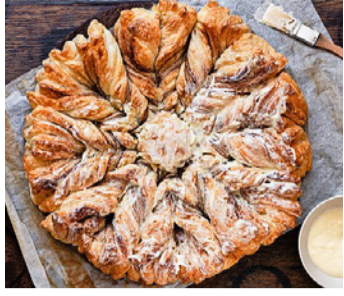
Ein süsser Stern auf dem Weihnachtstisch.