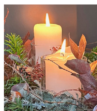
Es sind Kerzen und Themen auf dem Tisch.

Kaum ein Thema sorgt für so viel Sprengstoff wie die Hofübergabe. Für die ältere Generation bedeutet sie die Weitergabe eines Lebenswerks und Sicherheit. Für die jüngere Generation geht es um Verantwortung und die Chance, eigene Ideen umzusetzen. Doch die Entscheidung betrifft nicht nur Eltern und das übernehmende Kind. Auch Geschwister, die den Hof nicht weiterführen, fühlen sich oft übergangen oder wünschen Anerkennung für ihre eigenen Wege. Unterschiedliche Erwartungen prallen aufeinander – und die «heilige Zeit» verstärkt die Brisanz.